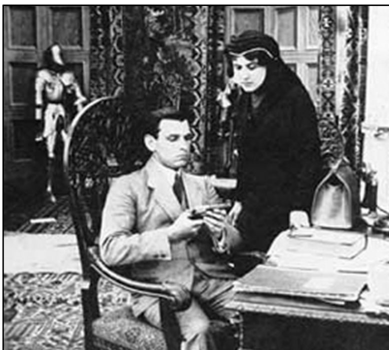
Slávkův oblíbený filmový pistolník Stuart Webbs v jedné ze svých filmových rolí

V období okolo třináctého až šestnáctého roku měl Slávek Foglar zájem především o brakovou literaturu. Nijak se tím nelišil od většiny svých vrstevníků. Co přesně četl, prozrazují sešitky, do nichž si zaznamenával, komu, kdy a co ze své knihovničky zapůjčil. Už z názvů samotných je úroveň těchto sešitových románů dostatečně zřetelná: Tajemství opuštěného dolu , Černá rakev plukovníkova , Dva stíny , Buffalo Bill , Poselství z hrobky , Stín bez hlavy , Zlopověstná krčma u přístavu , V doupěti Černého Toma , Tajemný případ Cliftona mladšího , Zelené světlo a další. 39 Vedle četby pokukoval i po biografu, pochopitelně především po kovbojkách. 40 Jeho klukovskou hvězdou byl dlouhou dobu Stuart Webbs, hrdina německých filmů. Protože Slávek působil v začínající pubertě starší, než skutečně byl, nejednou se úspěšně